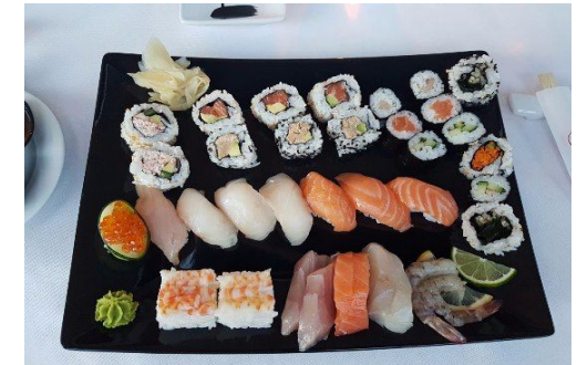
Sushi bar e Aperitivo all'Hotel Excelsoir