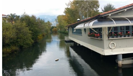
Passeggiata lungo Frigido

Partendo da Marina costeggiando il fiume si raggiunge il parco fluviale del Frigido dov'è possibile trovare la chiesa di San Leonardo del XII secolo. Vicino al sito più antico "AD TABERNAS FRIGIDAS" di origine romana.