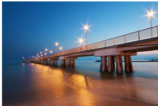
Pontile: Passeggiata romantica sul pontile

Partendo da Marina costeggiando il fiume si raggiunge il parco fluviale del Frigido dov'è possibile trovare la chiesa di San Leonardo del XII secolo. Vicino al sito più antico "AD TABERNAS FRIGIDAS" di origine romana.